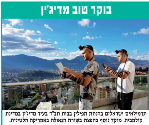
תורמילאים ישראלים בהנחת תפילין בבית חב"ד בעיר מדיג'ן במדינת קולמביה. מוקד נוסף בהפצת בשורת הגאולה באמריקה הלטינית.

ועדיין לא למדנו על מסירות נפשו תוך סיכון חיים ממש, עד שהדבר נחשף בפרשתנו. "וירא איש