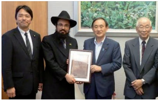
הרב בנימין אדרעי עם אנשי הממשל