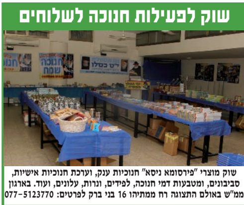
שוק מוצרי "פירסומא ניסא" חנוכיות ענק, וערכת חנוכיות אישיות, סביבונים, ומטבעות דמי חנוכה, לפידים, ונרות, עלונים, ועוד. בארגון מ"ש באולם התצוגה רח ממתיהו 16 בני ברק לפרטים: 077-5123770

לכל לראש מהבחינה התורנית, המהווה את הבסיס לקיומנו כאן בארץ הקודש. ארץ ישראל ניתנה לנו, לעם ישראל, בברית בין הבתרים לנחלת עולם ואין למישהו את הזכות למסור ממנה חלקים למי מהאומות ובוודאי שלא לתת ממנה לגרועים שבאויבינו. הזוי לחלוטין.