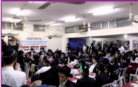
בראש חודש כסלו נערכה התוועדות מרכזית באולם מרכז ההפצה "ממש" בני ברק בהשתתפות משפיעים וקהל חסידים.

על גדלותו הרוחנית ודביקותו העילאית של אדמו"ר האמצעי בתורת החסידות, תעיד אימרתו המופלאה של חתנו אדמו"ר הצמח צדק שהעיד כי "אם היו חותכים לחותני אצבע לא היה יוצא דם אלא חסידות". ללא גוזמא, כפשוטו ממש.