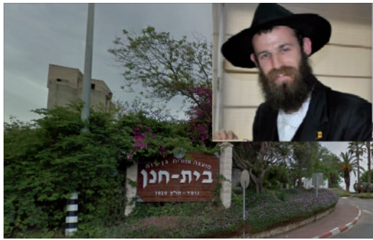
בכניסה לישוב בית חנן

אגב, בבחירות שהיו לפני שבוע בישוב, נבחר ליו"ר הוועד ידידינו.. דיקו, אותו יהודי שאיפשר לי לטבול בבריכת השחיה שלו, כבר בשבת הראשונה, עד שיוסדר עניין המקוה. איחולנו הלבביים להצלחתו עדי הגאולה בקרוב ממש.