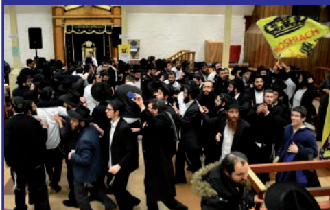
שישים יום של שמחה ב-770. מטה שירה זומרה, מארגן כמידי שנה יריקות מדי ערב בחודשי אדר, על פי הוראת הרבי שליט"א מלך המשיח

ואינו רואה בו סיפור עכשווי, הרי שהוא לא יצא מחובתו, עדיין נותר במצבו העגום. יש לראות בסיפור המגילה, את משמעותו העכשווית.