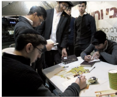
דוכן האגרות ע"י ציון הרמב"ם

זו הפעם הראשונה בה יכולו לצפות בהתוועדות עם הרבי שליט"א מלך המשיח, בחלוקת הדולרים ועוד. במשך ההילולא חולקו אלפי עלונים שעסקו בבשורת הגאולה ובדרישה לגאולה האמיתית והשלימה תיכף ומיד ממש.