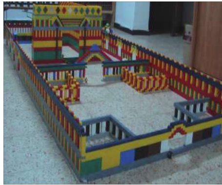
אחד מהדגמים העשויים מאבני הלגו

מול המבנה, מוקסמים מעבודתם, מגיע תורו של חידון קטן על החומר הנלמד. צריך לציין שבדרך כלל, הילדים שולטים בתשובות. בשלבים הראשונים של הקמת הסדנא עסקנו לא מעט, לעניין גני ילדים מוסדות חינוך באפיק יחודי זה של הפעלת הילדים, אך לא חלף זמן רב ויחודה של הסדנא התפרסם וכיום ב"ה, אנו פועלים בכל רחבי הארץ כשאנו במירוץ לספק את ההזמנות. בין הפונים גם ממסגרות לא דתיות.