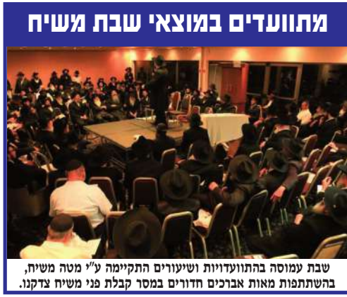
מחועדים במוצאי שבת משיח. שבת עמוסה בהתוועדויות ושיעורים התקיימה ע"י מטה משיח, בהשתתפות מאות אברכים חזורים במסר קבלת פני משיח צדקנו.

נסיון הממיסד להתעלם מכוונת הרצח בעת ידווי האבנים, הסתבך לאחרונה כאשר מח"ט בנימין נקלע לאירוע כזה. המח"ט שחש על בשרו את הסכנה שבידו אבן, יצא מרכבו ניהל מרדף קצר אחר המפגע, ירה בו והרגו. לראשונה משהו החליט לפעול כנגד מציאות הזויה, בה כל פורע ערבי רשאי לנסות לרצוח יהודי (ח"ו) באמצעות ידווי אבנים, בקבוק תבערה וכדומה, ביודעו מראש שכוחות