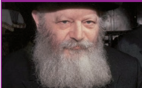
27 שנה לאמירת השיחה ביום ב' ניסן תשמ"ח, בה הסביר הרבי שליט"א מלך המשיח את חשיבות הכרזת "יחי המלך" המזרזת את הגאולה.