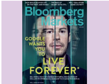
שער מגזין בלומברג-מרקטס על תגלית גוגל