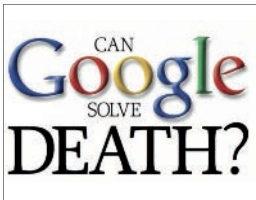
האם בידי גוגל הפתרון לתמותה?

הרבי שליט"א מלך המשיח מתייחס ליעוד זה לא אחת בשיחותיו הקדושות. כך למשל בשבת פרשת ויחי ה'תשנ"ב, הוא מציין שע"י מעשה טוב אחד זוכים לגאולה: "שאז יהיו לכל אחד ואחד מישראל חיים נצחיים כפשוטם, החל מבני ישראל שבדורנו זה, נשמות בגופים, לאורך ימים ושנים טובות, לא רק מאה ארבעים ושבע שנה, כשני חיי יעקב, ולא רק ק"פ (180) שנה כשני חיי יצחק, אלא חיים נצחיים, ועל דרך זה בנוגע לבני ישראל בכל הדורות שלפני זה, ש"הקיצו ורננו שוכני עפר",