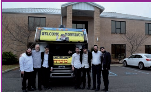
מספר בוגרי ישיבת "תומכי תמימים" ב-770, הפעילו גם השנה את 'טנק המבצעים' שטעם מפלוזידה לניו יורק, לזכות אלפי יהודים בקניונים נידחים, במצוות החנוכה.