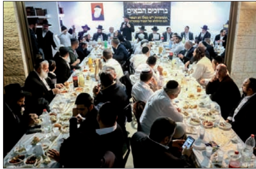
חלק קטן מהקהל באירוע