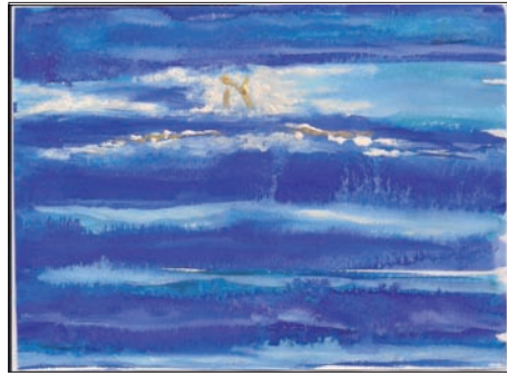
אלף שבמרכז - אומנות פנימית