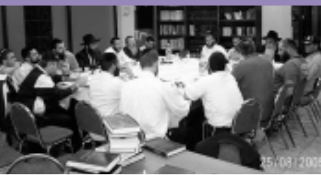
По пустынным улицам города носится "Катерина", а в Центре Хабада гости внимательно слушают раввина. Тьма опустилась над египтом, а в жилищах евреев был свет.