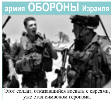
Этот солдат, отказавшийся воевать с евреями, уже стал символом героизма.