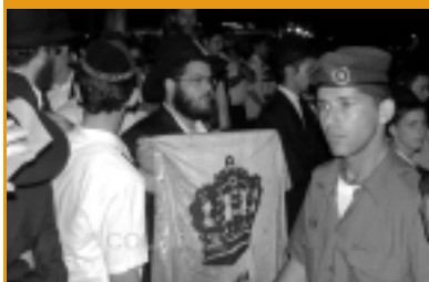
Тысячи учеников хабадских йешив собрались в Кфар-Хабате, чтобы вместе провести Шабат. На исходе Субботы был организован митинг протеста.