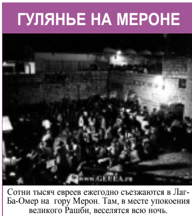
Сотни тысяч евреев ежегодно съезжаются в Лаг-Ба-Омер на гору Мерон. Там, в месте упокоения великого Рашби, веселятся всю ночь.