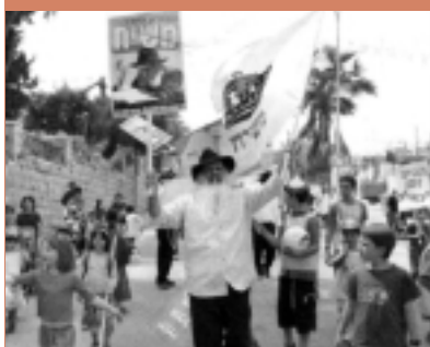
В пятницу, в праздник Лаг-ба-Омер все дети принимают участие в параде. Подробности - в местных центрах Хабада.