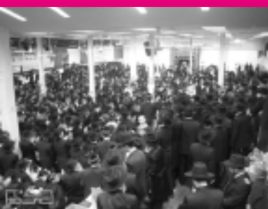
Тысячи гостей пришли в Дом Ребе "770" на трапезу Мошиаха в последний день Песаха.