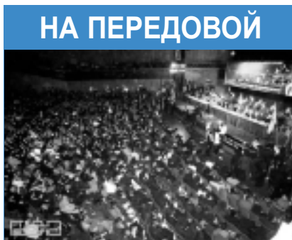
Свыше семи тысяч неравнодушных жителей Израиля собрались в прошлый четверг на митинг протеста против депортации евреев.

В одном из своих выступлений (Адар 5752 (1992) г.) Ребе упомянул этот закон и объяснил его духовный аспект, применив его к месяцу Адар, самому веселому месяцу еврейского календаря. "В високосном году, - сказал Ребе, - поскольку у нас есть Адар Алеф и Адар Бет, Адар в общей сложности длится 60 дней. Это напоминает нам закон о частице тrefной пищи, случайно попавшей в сосуд с кошерной, объем которой превосходит объем тrefной в 60 раз. Иначе говоря, тrefное полностью растворяется в дозволенном. В духовном смысле, если говорить о 60-и днях месяца Адар, это означает, что все нежелательные аспекты теряют свои "вкусовые качества" и полностью растворяются в 60-ти днях радости Адара! И для того, чтобы этот процесс проходил как можно активнее, мы должны увеличивать веселье!..."