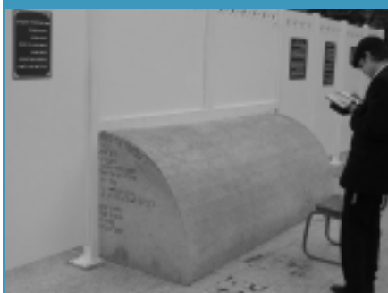
В прошедший Шабат, 20-го Тевета весь мир отмечал 800 лет со дня смерти РАМБАМА.

Чуть больше тридцати лет тому назад Ребе шлита Король Мошиах выразился достаточно категорично и совершенно недвусмысленно по поводу каких бы то ни было переговоров об уступках во всем, что касается Земли Израиля. Ребе сказал, что любые разговоры об отдаче территорий в общем и разговоры о палестинской автономии в частности приведут к созданию государства врага на Священной Земле. А