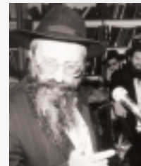
р. Бени Нахум

Мы поможем и Вам обратиться за советом к Ребе, звоните (03) 909 3894