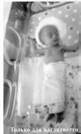
Только для наглядности

Поначалу все шло спокойно и обе они чувствовали себя хорошо. Прошло всего два дня, как вдруг у новорожденной безо всякой видимой причины резко поднялась температура. Врачи, проведя осмотр, не смогли установить диагноз, и решили лечить девочку антибиотиками. Жар, однако, не прекращался. Возникло подозрение, что у девочки острое воспаление легких. Ее срочно перевели в реанимационное отделение, подключили к монитору и стали поддерживать дыхание через кислородную маску. Но точного диагноза все еще не было.