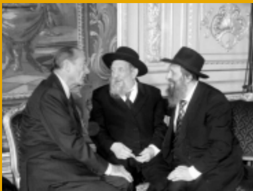
Посланники Ребе шлита Короля Мошиаха во Франции встретились с президентом этой страны Жаком Шираком в его дворце. Обсуждался вопрос безопасности евреев в Израиле и Франции.