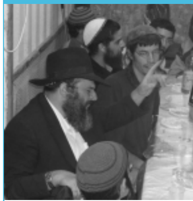
Фарбрэнген на холме "Мицпэ Ицхар"