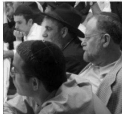
На хасидском фарбрэнгене