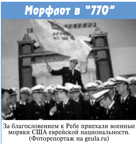
За благословением к Ребе приехали военные моряки США еврейской национальности.

Поражение в референдуме лишь усилило в нас чувство, что глава правительства настолько сжился с "идеей отмежевания", что даже самого себя решил "отмежевать" от каких бы то ни было обязательств.