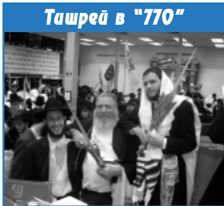
Тишрей в "770"

Сейчас такого веселья нет. Где же оно теперь? Где же ему быть - оно внутри Вас в Вашей еврейской душе. Еврейское веселье не умирает и не уезжает за границу. Поймите, синагога Ваша! Она в той же мере Ваша, как и моя. Приходите в свою синагогу на Симхас-Тэйро, приходите не как в театр, не для того, чтобы посмотреть на чужое ликование, а для того, чтобы веселиться, радоваться святому празднику самим. Радоваться тому, что мы евреи, и тому, что у нас есть Тора. Подняться от своей повседневности к Торе, сделать своим весельем шаг к самому себе. Ей-Б-гу, это здорово! "В день радости вашей..." - сказано в Торе. Нашей с Вами радости.