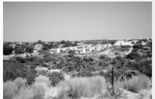
Один из поселков на побережье Газы

Мы уже писали в 305-м номере этого издания об удивительной метамарфозе с именем СЕЛА ("Помощь жителям еврейских поселений на побережье Газы"), которое было присвоено комиссии по изгнанию евреев в рамках плана "отмежевания", и за которым правительство Израиля пыталось спрятать свое истинное намерение в отношении поселенцев. Оказалось, что это название свидетельствует против самого себя – СэЛА, а не СэЛХА, как должно было быть, если бы речь действительно шла о помощи еврейским поселениям. «Забыв» добавить всего одну букву (букву Хет, первую букву слова Хевель - побережье), создатели комиссии продемонстрировали, что помогают они именно Газе! Иными словами, оказывают помощь и поддержку террористам, которыми Сектор Газы просто кишит. На этот раз, нам даже не пришлось трудиться над написанием статьи. О чуде с очередным названием для насильственной эвакуации евреев с земель, принадлежащих им по закону, поведал обычный сайт израильских новостей "МигНьюс".