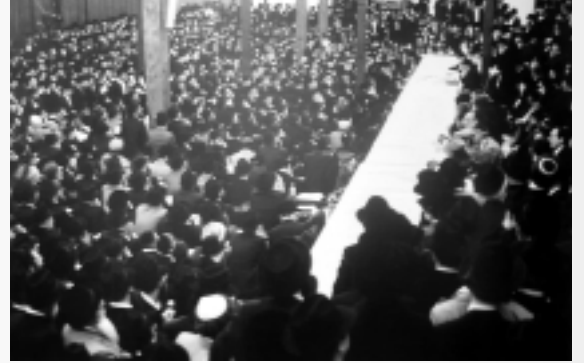
На хасидском фарбренгене