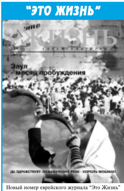
Новый номер еврейского журнала "Это Жизнь"