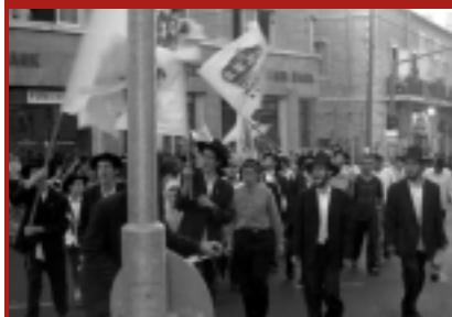
17 августа хасиды ХАБАДа проводят акцию в защиту жителей Газы. Тысячи хабданников во всем мире выйдут на улицы, чтобы как можно больше евреев выполнило заповедь возложения тфилин и прочитало молитву "Шма" - это проверенное средство против врагов.