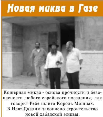
Новая миква в Газе

Заказывайте журнал по телефону: (03) 909-3894 в Израиле (718) 854-0006 в США.