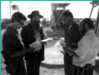
Создавая духовную поддержку операции ЦАХАЛа в Рафинахе, Бейт-Хабд Гуш-Катифа произвел печатание святой книги Тания прямо в Коридоре Филадельфия.