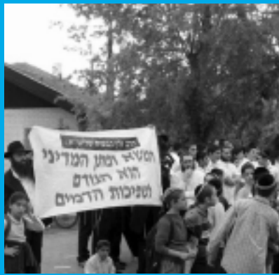
Ариэля Шарона, постившего в начале недели Кфар-Хабат, возмущенные хасиды встретили лозунгами протеста.