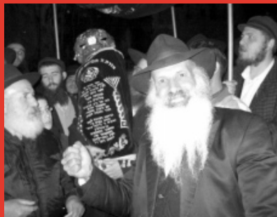
На прошлой неделе был внесен новый свиток Торы в коллель, созданный в честь праведницы Менухи-Рахель, дочери третьего Любавичского Ребе.