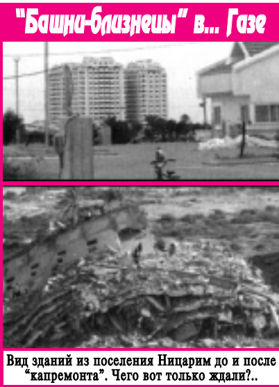
Вид зданий из поселения Ницарим до и после "капремонта". Чего вот только ждали?..

Конечно, хорошо, что три высотных дома, примыкающие к поселению Нецарим, были взорваны хотя бы после этого трагического инцидента. Но неужели раньше кому-то было не понятно, что палестинские власти построили три тринадцатизэтажные "башни" вовсе не для того, чтобы улучшить жилищные условия нескольким сотням своих сограждан? С первых дней своего существования верхние этажи этих зданий использовались террористами в качестве наблюдательных постов, с которых прекрасно просматривается не только весь Нецарим с его военными объектами, но и дороги, соединяющие это поселение с другими населёнными пунктами в секторе Газа и за его пределами. Израильские военные и гражданские власти знали это и, тем не менее, ничего не предпринимали, пока не произошла трагедия. Спрашивается, почему?