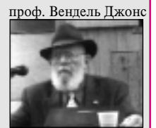
проф. Вендель Джонс