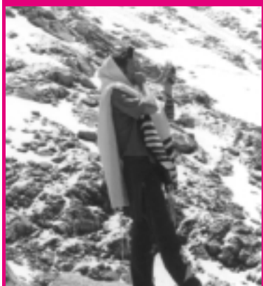
В месяце Элул по заказанию Ребе шлита хабадники проводят широкомасштабную компанию трубления в шофар. Звук шофара пробуждает выйти на встречу Мошиаха.