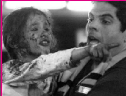
Теракт в Иерусалиме: пожинаем плоды "перемирия". Шарон любезно предоставил арабам время на подготовку новых злодеяний.