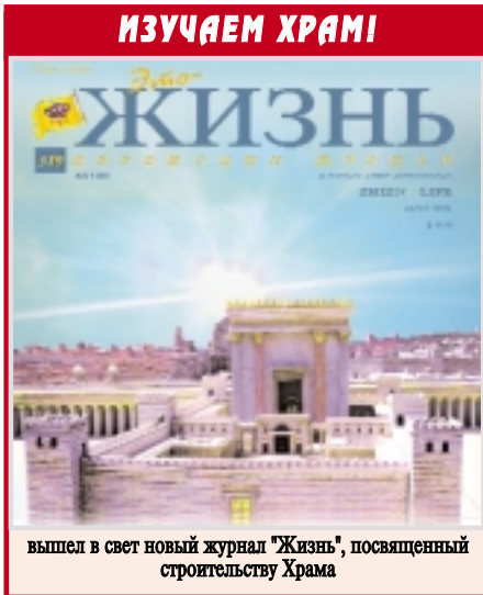
вышел в свет новый журнал "Жизнь", посвященный строительству Храма