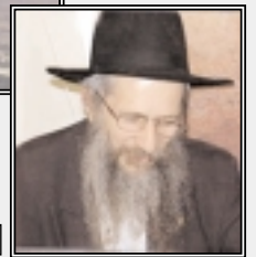
Гиди Шарон >>