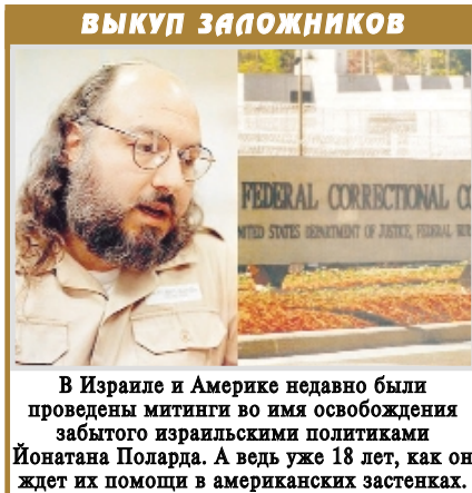
В Израиле и Америке недавно были проведены митинги во имя освобождения забытого израильскими политиками Йонатана Поларда. А ведь уже 18 лет, как он ждет их помощи в американских застенках.

Ваши подписи присылайте по адресу: Цфат, п.я. 6132.