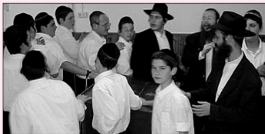
Веселье в честь чудесного спасения

Всё это время я слышал, как мальчики читают псалмы Давида. Многие из них кричали "Да живёт Король Мошиах". Стрельба продолжалась. Я знал, чем это