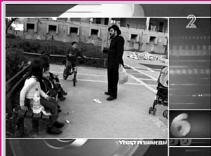
Хабадника, повторяющего с детьми на улице святые слова Торы, укоряли с экранов телевизоров в еврейской пропаганде... Вот так пуримская штука!