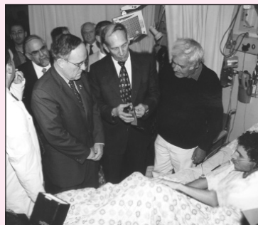
Мэр Иерусалима г. Олмерт и бывший мэр Нью-Йорка г. Джулиани рассматривают продырявленную монету из бумажника.