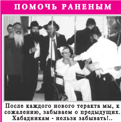
ПОМОЩЬ РАНЕННЫМ После каждого нового теракта мы, к сожалению, забываем о предыдущих. Хабадникам - нельзя забывать!..

Итак, начался ещё один год "каденции" Ребе. Именно сейчас - самое подходящее время укрепить каждому из нас свою связь с Ребе шлита Королем Мошиахом, увеличив изучение его работ и с точностью до мелочей исполняя его указания, главное из которых - привести мир к истинному и полному Освобождению!..