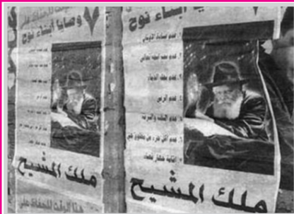
Центр распространения семи заповедей сыновей Ноаха, украсил улицы арабских деревень плакатами с вестью о Геуле.