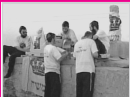
Печать книги "Тания" у колодца Авраама - того самого, где раб Элейзер ждал Ривку и где Яков встретился с Рахелью.