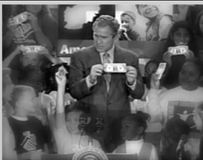
Президент Буш призывает детей дать доллар в пользу детей афганских беженцев