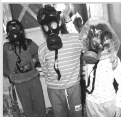
Ребе заверил: "Газовой атаки не будет и противогазы не понадобятся".