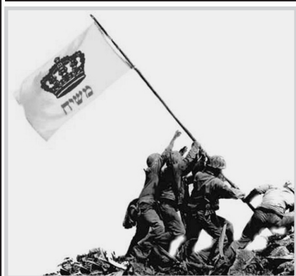
Десять лет со дня окончания войны в Персидском Заливе (в Пурим). Сбылось пророчество Ребе - Израиль самое безопасное место.