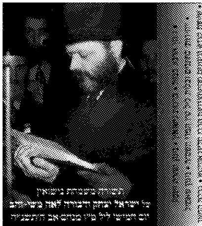
Беседы и напевы Короля Мошиаха

также письма наших Рабеим, даже их письма семьям жениха или невесты. Или “Сборник обычаев Короля” - в основном о том, как поступает Ребе, Король Мошиах, шило , во время молитвы и готовясь к ней.