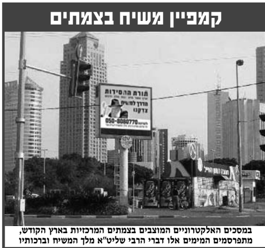
במסכים האלקטרוניים המוצבים בצמתים המרכזיות בארץ הקודש, מתפרסמים המימים אלו דברי הרבי שליט"א מלך המשיח וברכותיו

מאלפת העובדה ששנאתו זו של המן, הביאה גם לגילוי רובד