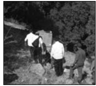
צועדים עם המכונה

ההדפסה שנערכה בסוף-השבוע שעבר, בתיאום עם פיקוד צה"ל, הייתה בלתי-שגרתית בעליל.