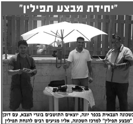
בשכונה הצבאית בכפר יונה, יוצאים התושבים בוגרי הצבא, עם דוכן "מבצע תפילין" למרכז השכונה, אליו מגיעים רבים להנחת תפילין