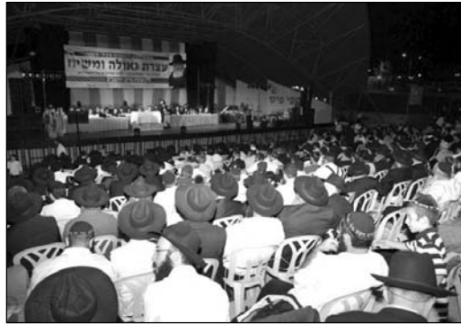
חלק מהקהל העצום על רקע בימת הכבוד. "אתה בחרתנו" מניגוני הרבי שליט"א מלך המשיח.