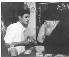
בחלוקת הדולרים. (תמונת ארכיון)

למרות כל זאת, ראו בני המשפחה בכך מופת ונס בזכות אותו שטר.