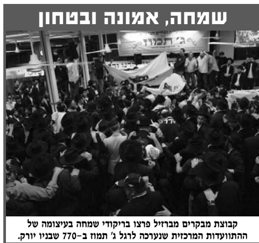
קבוצת מבקרים מברזיל פרצו בריקודי שמחה בעיצומה של ההתוועדות המרכזית שנערכה לרגל ג' תמוז ב-770 שבני יורק.

מבחינתנו, מהווה הרעש התקשורתי, רמז ואות משמים, להגביר את הפעילות להפצת חשיבות הטבילה, להוספה בבניית מקוואות, להפצת חומר הסברה בכתב, בחוגים ובשיעורים ובשיחות פא"פ. פשוט לדבר אל הנשמה והובטחנו ש"דברים היוצאים מן הלב נכנסים אל הלב" ובוודאי יפעלו פעולתם, עדי קיום היעוד "וזרתי עליכם מים טהורים וטהרתם" בגאולה האמיתית והשלמה ע"י הרבי שליט"א מלך המשיח, ומתוך שמחה וטוב לב.