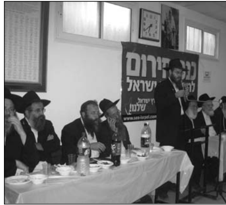
חלק מהרבנים בבית הכבוד

המשתתפים קיבלו תיקיה עם חומר הסברה על פעילות המטה ופרסומי המטה לאחרונה.