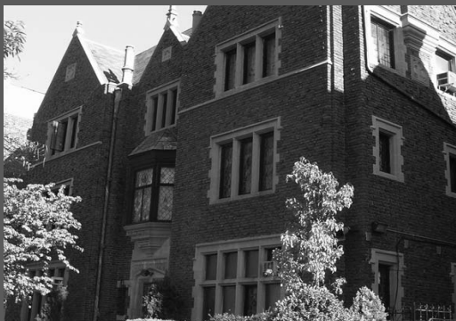
כ"ח סיון, היום בו הגיע הרבי שליט"א מלך המשיח ל"חצי כדור התחתון" – ארצות הברית. מיום זה נפתח השלב האחרון בהכנת העולם לגאולה בקרוב ממש. בתמונה: בית משיח 770 בניו יורק